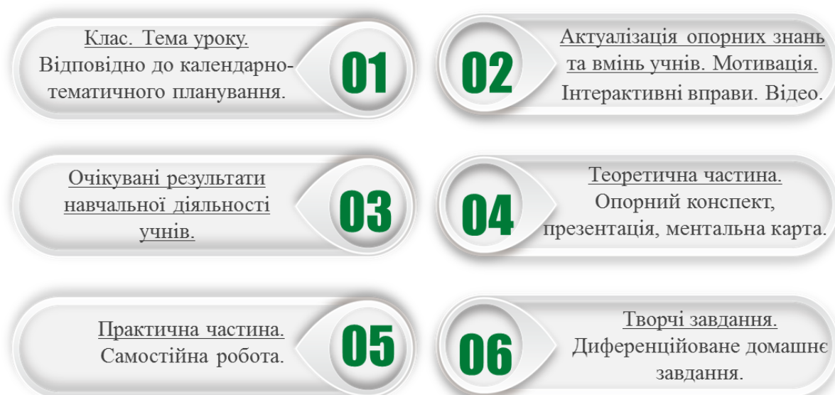
Рисунок 1 – Кейс уроку з трудового навчання

1. Координацію освітньої діяльності здійснювати за допомогою кейсу уроку. Підготувати та розмістити конспекти уроків (відео, практичні завдання, тести тощо) на обраній платформі (закладу освіти або вчителя) (рис.1).